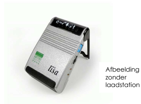
Afbeelding zonder laadstation

Trillen + alle indicatielampjes: melding rook/brandmelder