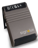
Afbeelding zonder laadstation

Wanneer er een signaal van deurbel, telefoon of rook/brandmelder binnenkomt, zal de trilontvanger 1 minuut lang gaan trillen. U kunt zien aan het symbool dat oplicht om welke signaal het gaat.