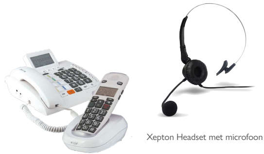
Xepton Headset met microfoon

Er zijn veel manieren om een werkomgeving veiliger, efficiënter en effectiever te maken. Daarom komen wij, in overleg met de klant, vaak uit op een maatwerkoplossing die bestaat uit meerdere systemen en producten. Enkele voorbeelden van materialen die wij in kunnen zetten bij een werkplekaanpassing lichten wij in deze folder uit: