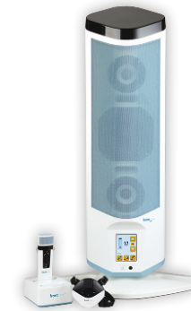
Juno Frontrow Set

Aula's, zalen en zelfs vergaderruimtes zijn vaak lastig voor mensen met hoor- (en spraak)problemen. Niet als ze Hoorexpert hebben ontdekt! Ons assortiment bevat moderne oplossingen om spreken, presenteren en luisteren te ondersteunen. Zo kunnen onze ringleidingen- en communicatiesystemen worden gekoppeld met diverse input-devices zoals smartboards, laptops, midi-sets, streamers en uiteraard microfoons en ze kunnen deze geluidssignalen (desnoods versterkt) draadloos sturen naar gehoorapparaten, speakers, inductielussen, koptelefoons enzovoorts. Zo zijn deze systemen niet alleen nuttig voor slechthorenden maar ook voor mensen die zich niet goed kunnen concentreren of zich in een andere ruimte bevinden of voor sprekers die een verminderde stemkracht hebben.