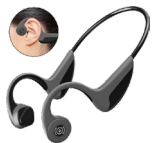
Music Vibes Bluetooth Headset met beengeleiding