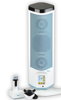
Juno Frontrow Set

Aula's, zalen en zelfs vergaderruimtes zijn vaak lastig voor mensen met hoor- (en spraak)problemen. Niet als ze Hoorexpert hebben ontdekt! Ons assortiment bevat moderne oplossingen om spreken, presenteren en luisteren te ondersteunen. Zo kunnen onze ringleidings- en communicatiesystemen worden gekoppeld met diverse input-devices zoals smartboards, laptops, midi-sets, streamers en uiteraard microfoons en ze kunnen deze geluidssignalen (desnoods versterkt) draadloos sturen naar gehoorapparaten, speakers, inductielussen, koptelefoons enzovoorts. Zo zijn deze systemen niet alleen nuttig voor slechthorenden maar ook voor mensen die zich niet goed kunnen concentreren of zich in een andere ruimte bevinden of voor sprekers die een verminderde stemkracht hebben.