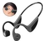
Music Vibes Bluetooth Headset met beengeleiding