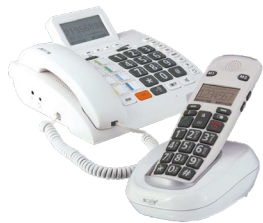
Scalla 3 telefoon met handset

Er zijn veel manieren om een werkomgeving veiliger, efficiënter en effectiever te maken. Daarom komen wij, in overleg met de klant, vaak uit op een maatwerkoplossing die bestaat uit meerdere systemen en producten. Enkele voorbeelden van materialen die wij in kunnen zetten bij een werkplekaanpassing lichten wij in deze folder uit: