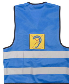
Limited Hearing veiligheidshesje

De geactiveerde rookmelder signaleert via tril-pager en/of 360-graden flitslamp