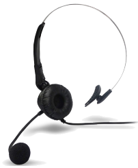
Xepton Headset met microfoon