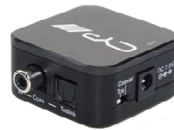
Audio converter Digitaal/Analoog