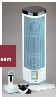
FrontRow sound-field Audiosysteem

FrontRow Juno is 's werelds meest geavanceerde sound-field Audiosysteem. FrontRow Juno heeft een zeer hoge digitale audiokwaliteit. Met het eenvoudig te bedienen touchscreen kan het gemakkelijk aan de luisterbehoefte worden aangepast.